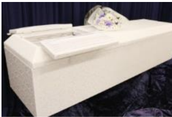
布張り棺 ホワイト