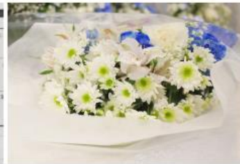
棺上花束 (色合い調製可能)