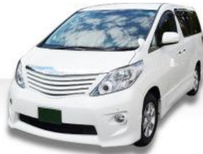
寝台車 (病院等 → 霊安室)