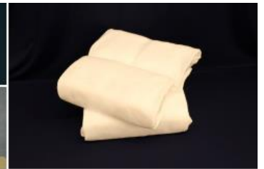
ドライアイス処置