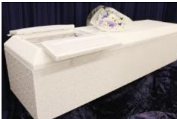
布張り棺 ホワイト