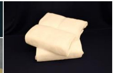
ドライアイス処置