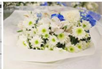
棺上花束 (色合い調製可能)