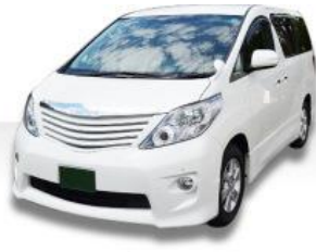
寝台車 (病院等 → 霊安室)