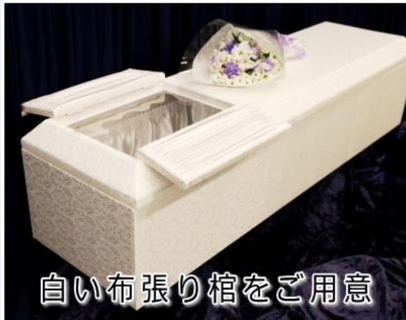
白い布張り棺をご用意